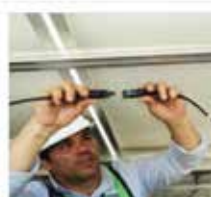
Quick Service After load cell change, use without re-calibration for non-legal for trade scales