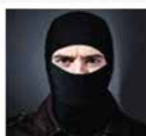
Preventing Fraud & Cheating Very difficult to cheat through secure digital 96LC RS 485 communication