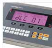
Lowest Service Costs Easy and quick fault finding, detects problems and simplifies service