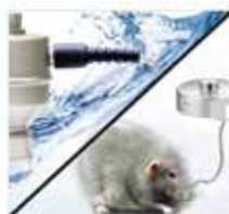
Heavy-duty And Water Resist Cables Dual core cable, creates a protective shield protected by braided stainless steel sheathing