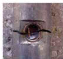
Rust & Corrosion The fully welded stainless steel structure, hermetically sealed, IP68 protection class