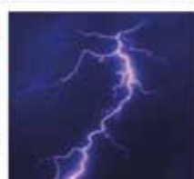
Lightning & Surge Voltage Protection Standard use with LPK24 Protection & Power Supply Kit for 100-240VAC models