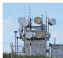
Eliminated Spoiling Influences Operation Temperature & Voltage variation, Radio and Electromagnetic effects