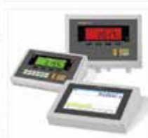
Advanced Weighing Functions Operates with intelligent European/OIML approved BAYKON weight indicator or terminals